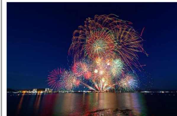
湖北エリアからの花火

湖岸に面した堤防の下側の席です。ご家族やグループでの利用におすすめ。シートが必要な場合は各自でお持ちください。