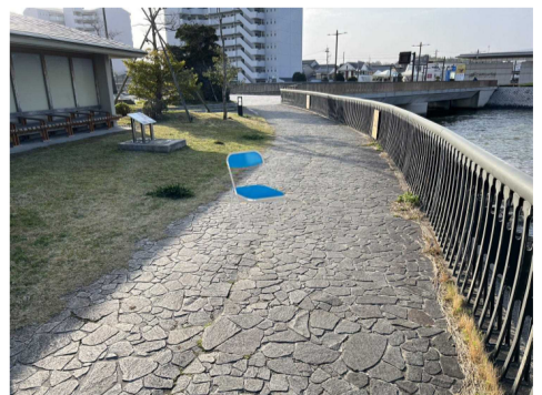
【J】白潟椅子席(わけあり席)

白潟公園の芝生を利用した席です。ご家族やグループでの利用におすすめ。シートが必要な場合は各自でお持ちください。