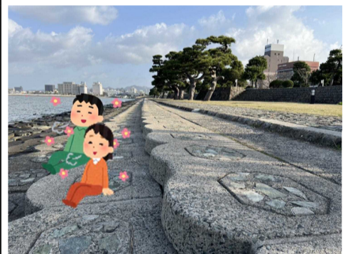
【K】白潟水しぶきペア席